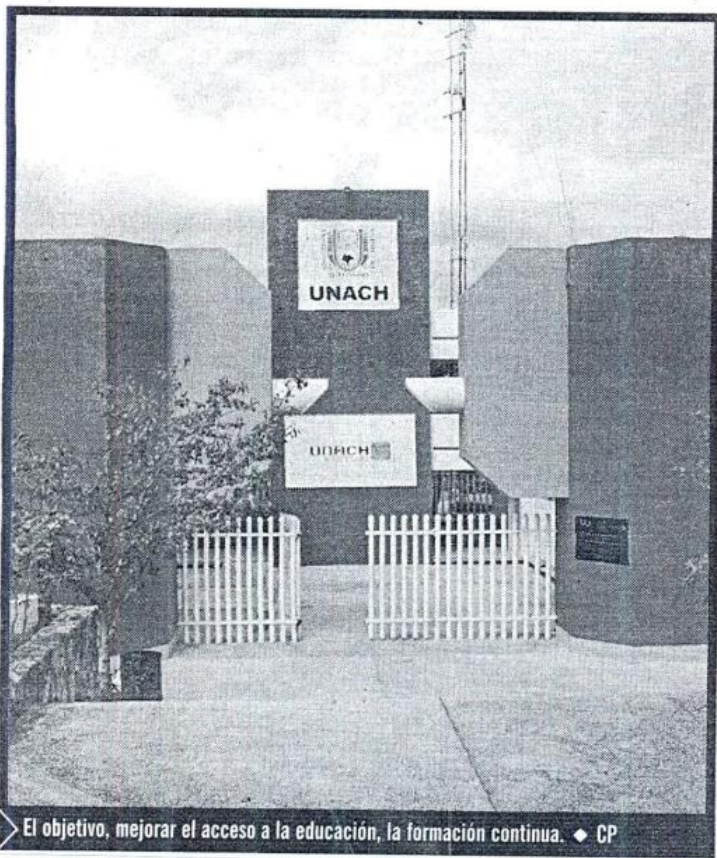
El objetivo, mejorar el acceso a la educación, la formación continua. ♦ CP

►MdeR. ♦ CP. Como reconocimiento a la calidad de su trabajo institucional, la Universidad Autónoma de Chiapas (UNACH) se suma al Proyecto de Investigación, Conocimiento, Inclusión y Desarrollo (CID), creado por la Conferencia de Rectores de las Universidades Italianas (CRUI), con recursos del Programa ALFA III, de la Unión Europea.